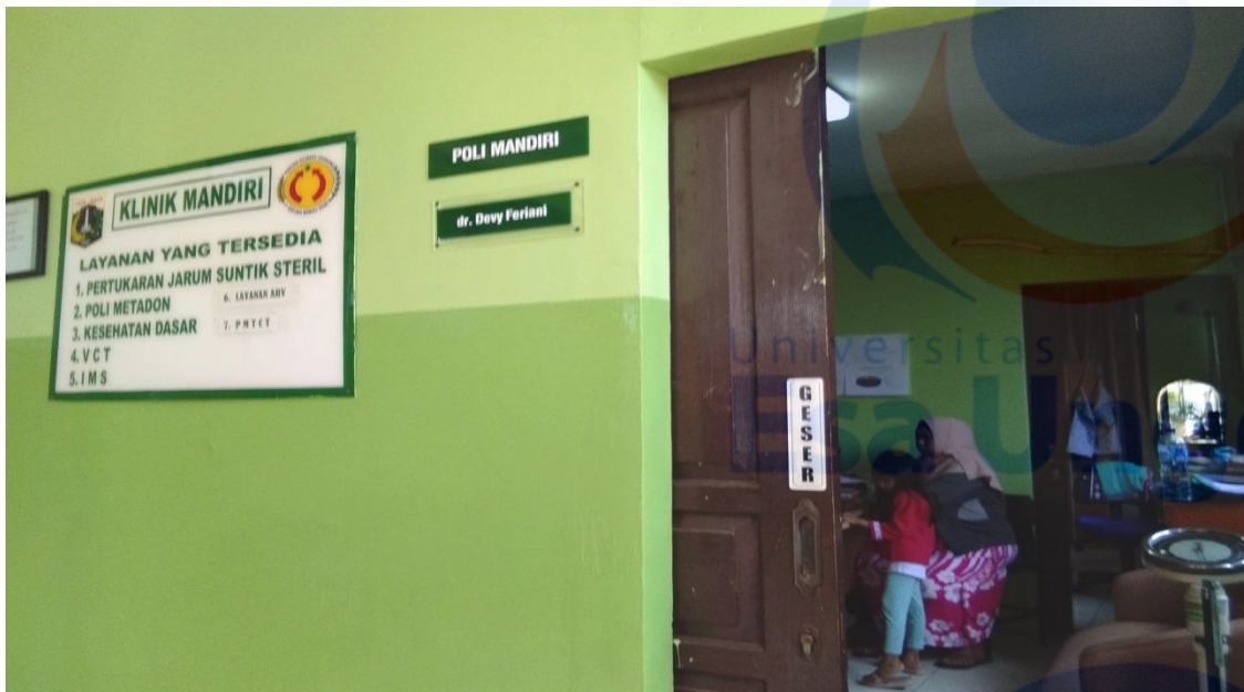
Gambar 3 : Foto Ruang Konseling 1