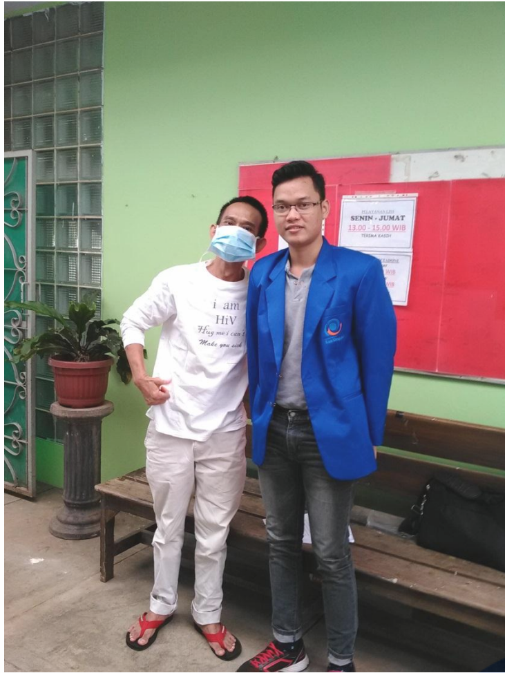
Gambar 2 : Foto Bersama Pasien