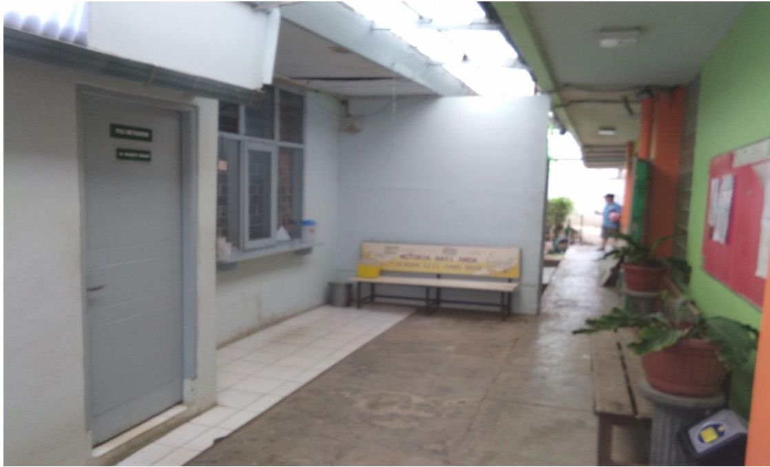
Gambar 4 : Foto Ruang Konseling 2