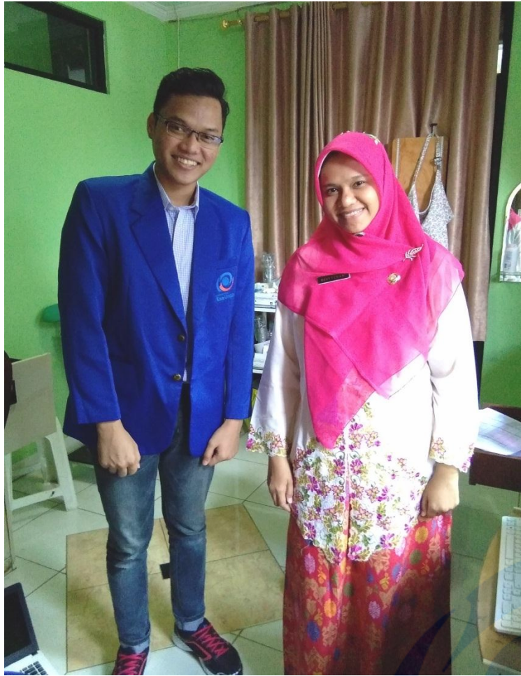
Gambar 1 : Foto bersama dokter VCT